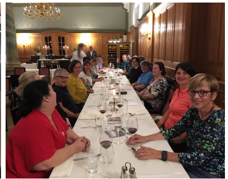
Mitarbeitende und Vorstand des Vereins Haushilfe beim Ausflug auf den Pilatus vom 12. August 2019.