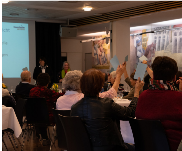
Impressionen von der Jubiläums-Mitgliederversammlung.