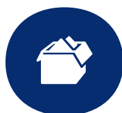
Unterstützung beim Umzug