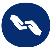
Begleiten zu Terminen