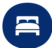
Betten Bettwäsche wechseln