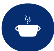
Mahlzeiten wärmen oder kochen