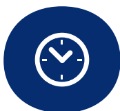
Entlasten von Angehörigen